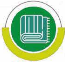
مشروع التعليم الجامعي