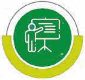
مشروع الأسر المنتجة