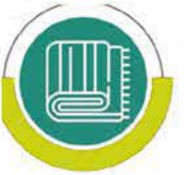
مشروع كفالة الأيتام