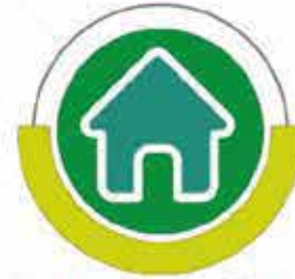
مشروع صيانة وترميم مساكن