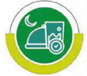
مشروع بناء المنازل