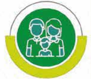
مشروع السلات الرمضانية