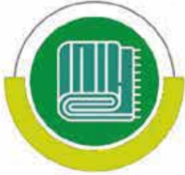
مشروع دفع الشتاء