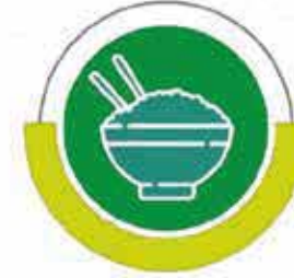
مشروع استقبال وتوزيع الزكاة