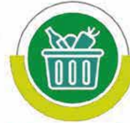
مشروع السلة الغذائية