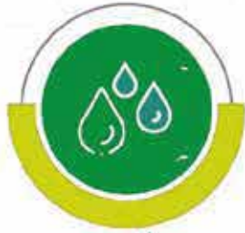
مشروع سقيا الماء